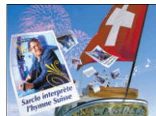
Chantez à bord de la CGN.

→ Départs de plusieurs villes du Léman. Horaires et réservations au 0848 811 848.