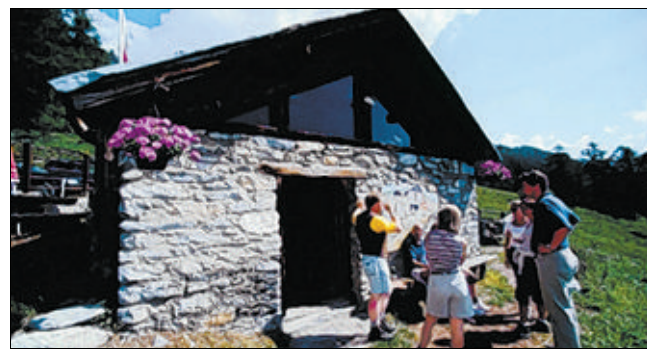
Allez voir le lever du soleil sur l'alpage de Colombire.